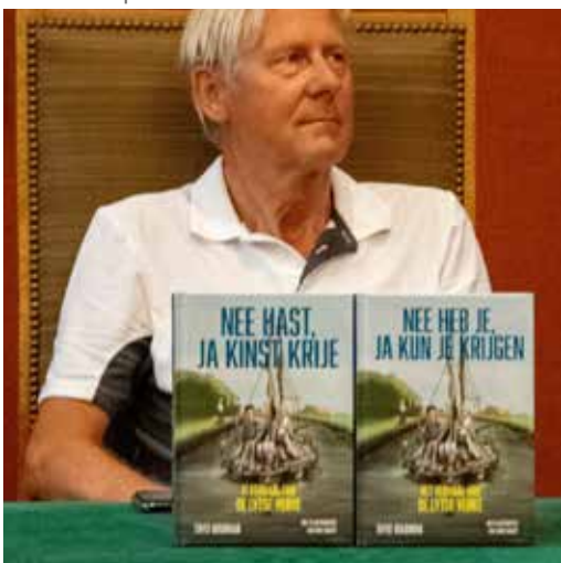
Nee heb je, ja kun je krijgen, Sterke Yerke