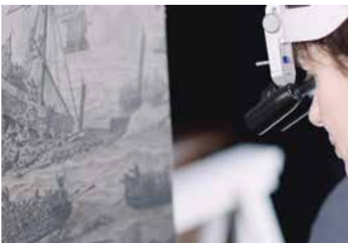
Restauratie schilderij Willem van de Velde, Stedelijk Museum Alkmaar