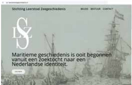
Stichting Leerstoel Zeegeschiedenis