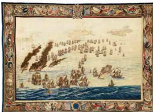
Wandkleden Willem van de Velde de Oude, het Scheepvaartmuseum Amsterdam